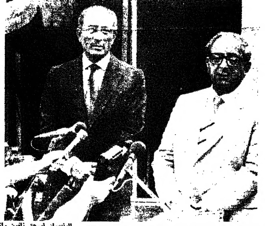
الرئيس اسحق نافون ونائبه السيد نافون في قرية بيت الكوم بعد اتمام زيارتهما اكد انه لا رجعة عن ديب السلام، وقال انه تم التوصل الى اتفاقيات مبدئية بالنسبة لحدود الحكم الذاتي وموضوع تطبيع العلاقات...